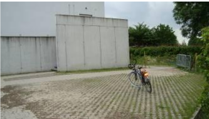
Puls (nr 11 op kaart)

Als we fietsen willen promoten, moeten ook de voorwaarden daartoe optimaler worden, meer bepaald: waar kan mijn fiets terecht? Een grondige analyse van de huidige toestand leert ons dat de fietsstallingen in Ternat voor veel verbetering vatbaar zijn.