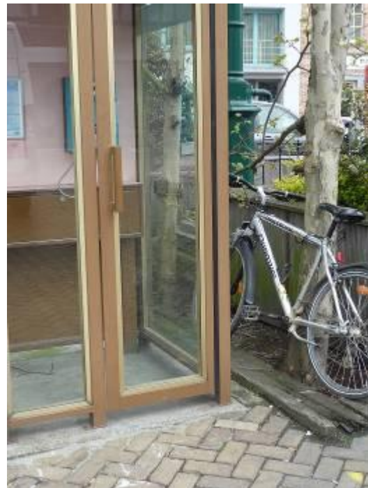
Foto boven; Iemand die op de Markt van Ternat de bus neemt en zo zijn fiets moet achterlaten.....(nr14)